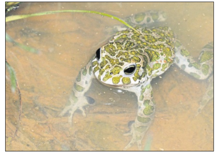
DIE TIERWELT IM FOKUS: In der Rheinebene zwischen Basel und Karlsruhe werden beim Projekt „Ramsar-Rhinature“ für verschiedene Arten Schutzprogramme entwickelt, unter anderem für den Kiebitz und die Wechselkröte.

weise auf französischer Seite und nur ein knappes Dutzend auf der anderen Rheinseite. Andere Vogelarten verteilen sich aber auch mehr oder weniger gleichmäßig entlang des Rheins, allerdings gibt es in keinem Fall mehr Brutnachteile auf deutscher Seite. „Das